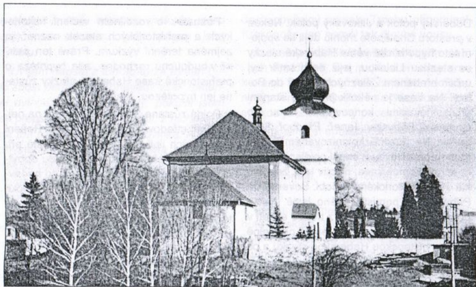
Nížkovský kostel sv. Mikuláše – v popředí menší stavba kostnice