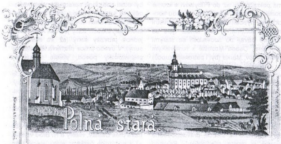
dopisní papír s vyobrazením Polné