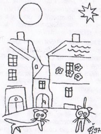
Č. Vašák: Ze staré Jihlavy

Výstava Čestmíra Vašáka Obrázky z Vysočiny se konala ve dnech 4. - 23. 8. 1997 v Knihkupectví a čajovně Kuba a Pařízek, Jihlava, Masarykovo náměstí č. 21.