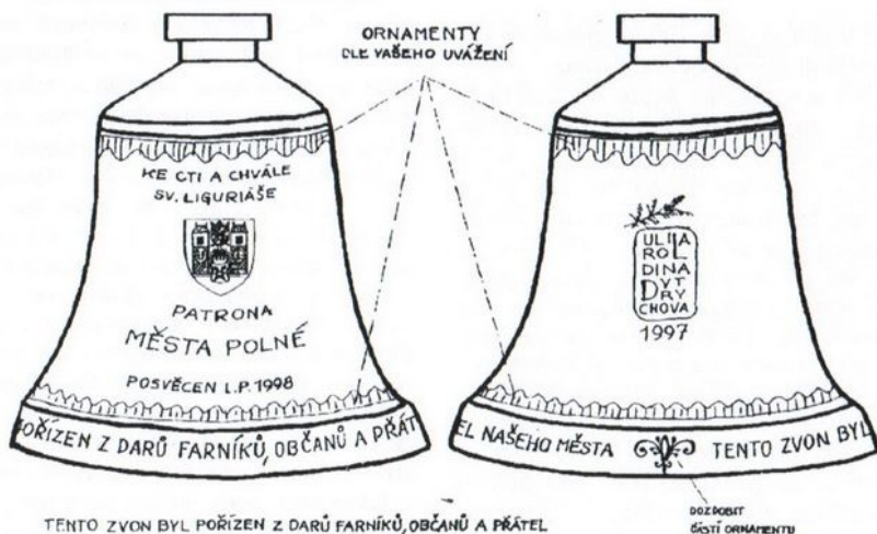
TENTO ZVON BYL POŘÍZEN Z DARŮ FARNÍKŮ, OBČANŮ A PŘÁTEL