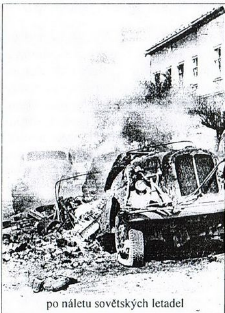
po náletu sovětských letadel

Následovala, naštěstí krátká řádka dnů naplněných strachem, nejistotou a