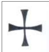
něm. rytíři (černý)