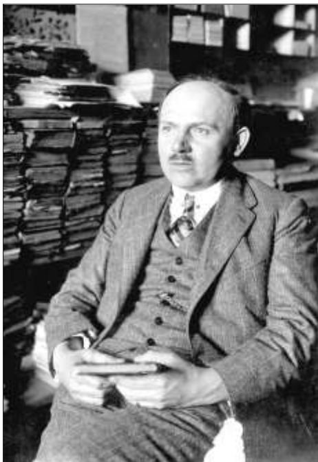
v Husově knihovně, kol. r. 1930