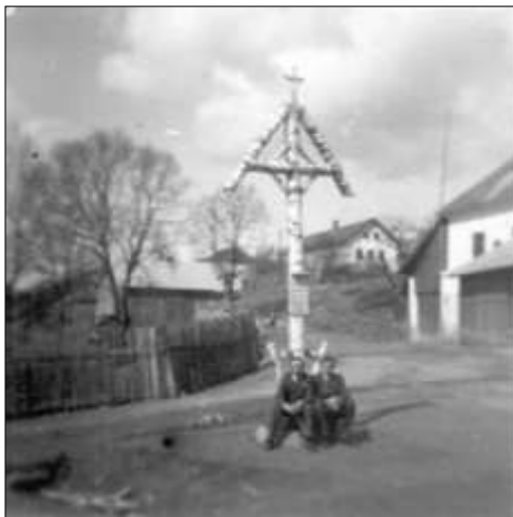
Na snímku vpravo původní podoba tzv. rumunského kříže, postaveného v Dobroutově u příležitosti odchodu rumunského vojska