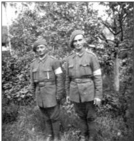
Na snímku vlevo pořádková hlídka rumunské armády na zahradě u Nejedlých, květen 1945