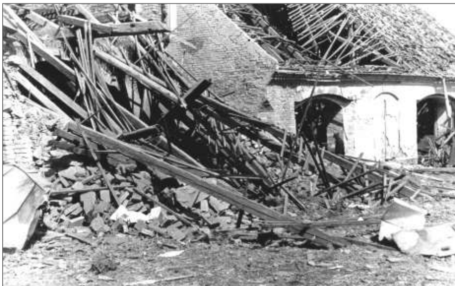
Salášková stodola po výbuchu munice 15. května 1945