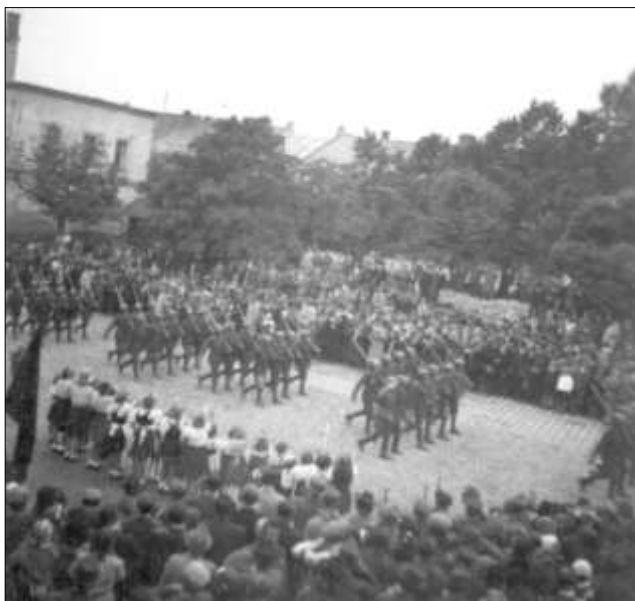
Slavnostní přehlídka příslušníků rumunské armády u příležitosti ukončení pobytu na Polensku 13. června 1945