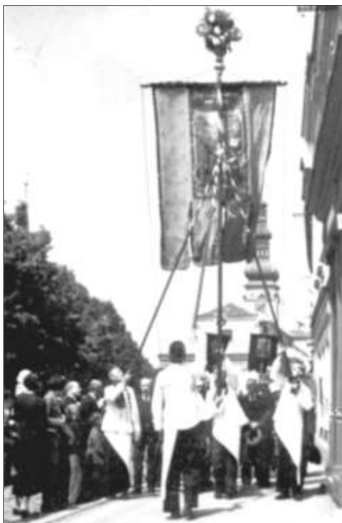
Cech polenských řezníků (foto z 30. let)

(od roku 1886 se zde konalo 12 trhů ročně na hovězí dobytek). Cesta dobytčete od jeho prodeje řezníkovi na porážku do jatek byla krátká. Vybudováním městských jatek se nepochybně zlepšila i hygiena porážek zvířat prováděná jednotlivými řezníky ve chlévech. U jatek se můžeme pozastavit nad problematikou potřebného zdroje vody. Nedaleký městský vodovod byl vybudován v roce 1905. Jatkám musela do té doby stačit jejich studna nebo voda z potůčku vytékajícího z Varhánkova rybníku. V době zahájení provozu jatek nebyla ve městě zavedena ani elektřina potřebná pro chladírny, které se musely spokojit s ledem z místních rybníků. Zdravotní dohled na porážku zvířat měli místní zvěrolékaři; počátkem století to