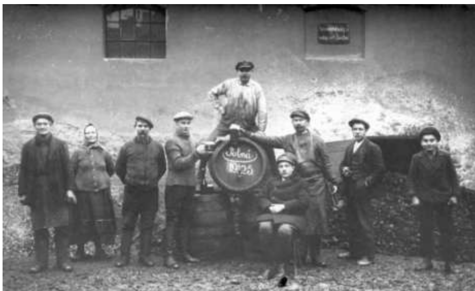
Zaměstnanci pivovaru, foto z roku 1925

pitnou vodu vystavěný v roce 1906 byl osvobozen od daní s tím, že voda nebude dodávána průmyslovým podnikům. Zároveň bylo uvedeno, že vody je nedostatek a nevystačuje ani potřebám obyvatelstva. Pro průmyslové podniky byl určen druhý vodovod z Varhánkova rybníku. Z něj voda omezována nebyla, ovšem „bud' poruchou v potrubí neb následkem malého tlaku vody nepřitékalo do hlavní kašny vody takové množství, aby stačila pro všechny... podniky města.“ 5 Pivovaru pak město navrhovalo zřízení vlastního vodovodu z blízké louky.