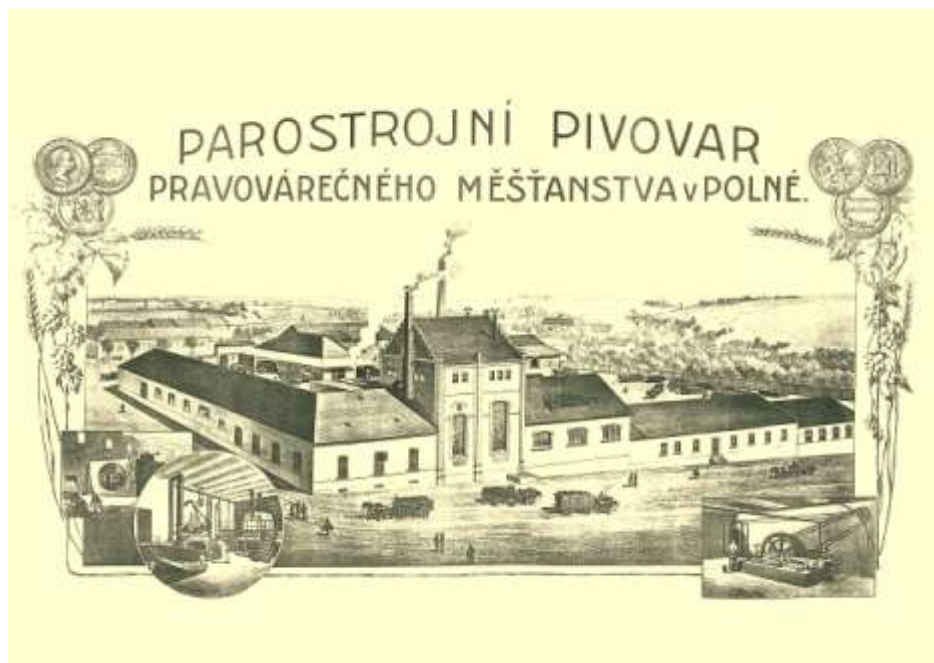
Stylizovaná litografie Měšťanského pivovaru v Polné, zhotovená v Lipsku za účelem propagace na Hospodářské výstavě v roce 1886 v Kutné Hoře

Ponechme stranou fakt, že ne vše se z těchto vizí vyplnilo a zaměříme se na vodu. Pivovar požadoval obnovení jednoho z rybníků (Zimova), 4 od něj pak měla vést voda ke stávajícímu vodovodu za předpokladu většího tlaku. Hráz Zimova rybníku měla být zajištěna proutím, aby se odstranily následky poškození hráze při kladení vodovodu. Ve stávající kašně mělo dojít k omezení volných výtoků vody. Nově získaná voda měla být přesně rozdělena mezi jednotlivé průmyslové podniky ve městě (jatká, elektrárna). V posledním bodě byl vyjádřen záměr podpory domovních přípojek užitkové vody, kterými se měl odstranit nedostatek vody pitné. Pivovar chtěl těmito kroky docílit možnosti vystavovat 8 tisíc hl piva ročně.