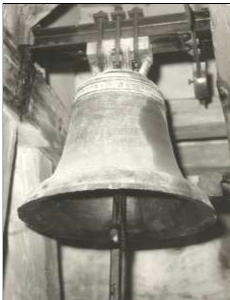
Zvon sv. Markéta z r. 1400 ve Zhoři