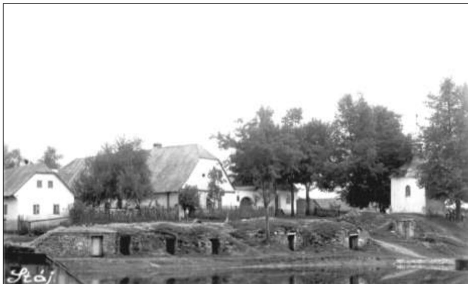
Kaple sv. Jana Nepomuckého ve Stáji – pohlednice z r. 1940