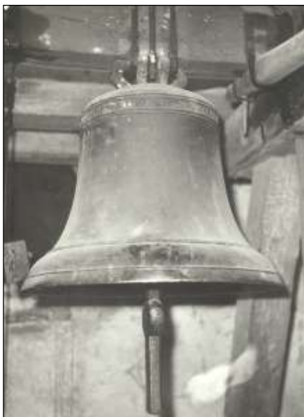
Zvon sv. Vavřinec z r. 1515 ve Zhoři