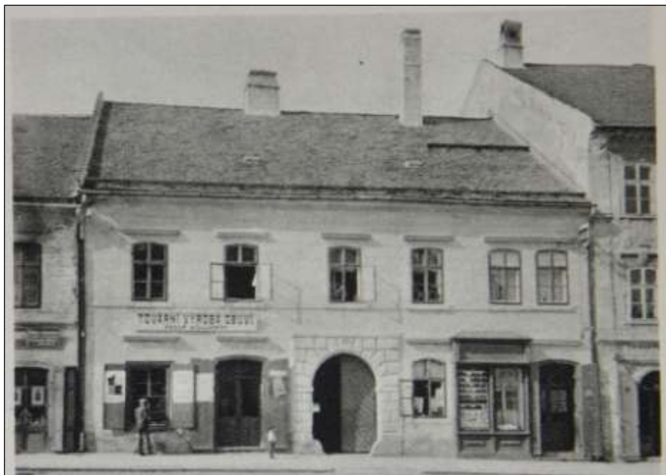
Dům čp. 47 na Husově náměstí v Polné; v pravé části domu, v přízemí, bydleli Němcovi v letech 1840 až 1942

Nebeský. Již rok po vystěhování z Polné publikuje Němcová časopisecky báseň Ženám českým a také kratší regionální pověsti. Brzy nato se prezentuje a v literárních kruzích získává první uznání knižně vydanými pohádkami.