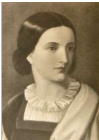
Divčí portrét B. Němcové