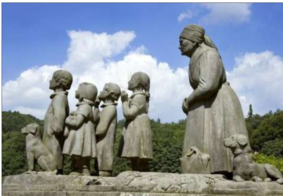
Pomník Babička s dětmi od sochaře Otto Gutfreunda, odhalený v Babiččině údolí v roce 1922

Babička je nejen nejznámějším, ale i nejvydávanějším českým literárním dílem. Bylo napsáno v době těžké osobní krize a ve značné bídě autorky. Božena Němcová zde vrcholně uplatnila svůj vypravěčský talent, který vede čtenáře jednotlivými příběhy vesnického společenství na pozadí ročních období s příslušnými lidovými zvyky, uprostřed krásné přírody. Autorka používá bohatého a živého lidového jazyka. Dílo je vedeno myšlenkou, že mravní kvalita prostého člověka zvítězí v nespravedlivém světě. Na čtenáře působí výjimečná harmonie a vypravěčská pohoda.