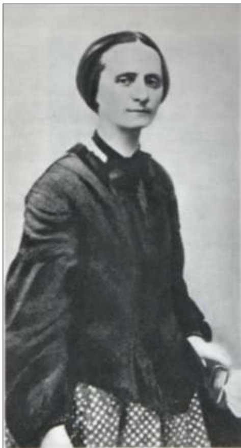
Poslední fotografie Boženy Němcové

četla B. Němcovou, všechny její povídky na mě dýchaly krásou. K málokterému jinému autorovi jsem cítila takový obdiv a porozumění, cítila výchovu k dobru. Její pozitivní vliv je ve mně dodnes. A mé uznání je naopak ještě větší, když si uvědomím, že životní podmínky (nemoc, chudoba) pro ni nebyly v její době právě nejpříznivější.