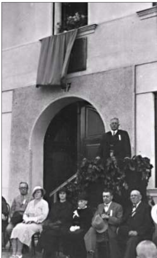
Odhalení pamětní desky v Polně r. 1934