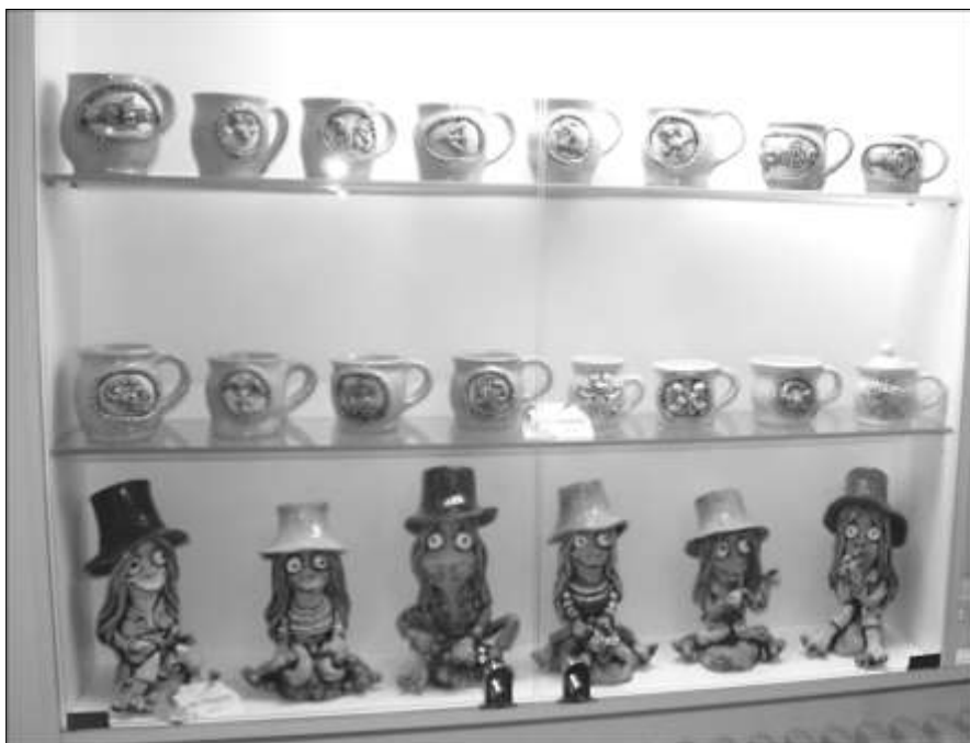
Ukázka tvorby Miroslavy Bílkové

S tvorbou Miroslavy Bílkové se lze podrobně seznámit na internetových stránkách: www.keramikamb.cz .