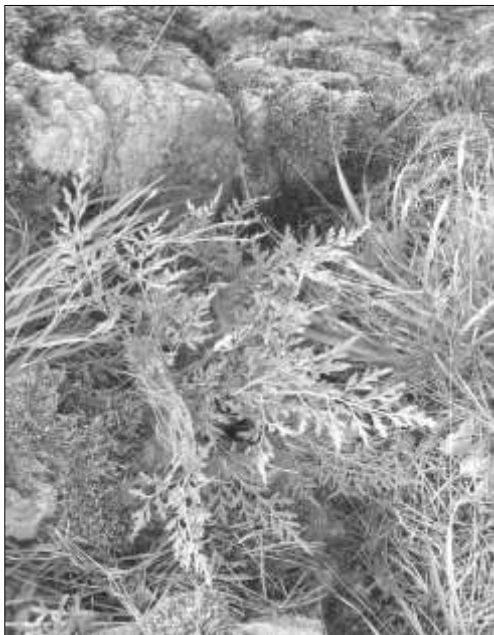
Sleziník hadcový v polenské lokalitě