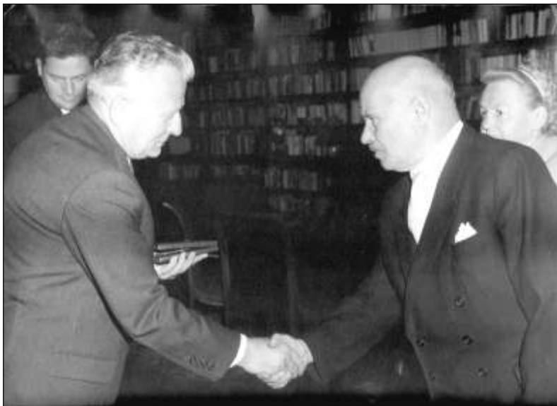
Prezident ČSSR Antonín Novotný předává 18. září 1965 Jindřichu Pešákovi na Pražském hradě Řád republiky

Tolik text letáku. Dodejme, že poslanec KSČ Jindřich Pešák zemřel 30. 11. 1979 v Jihlavě.