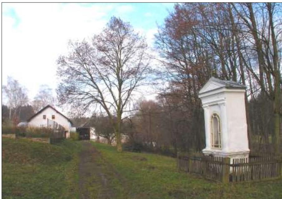
mlýn na Lutríánu v roce 2004