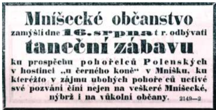
Jedno z mnoha oznámení v tehdejší periodickém tisku