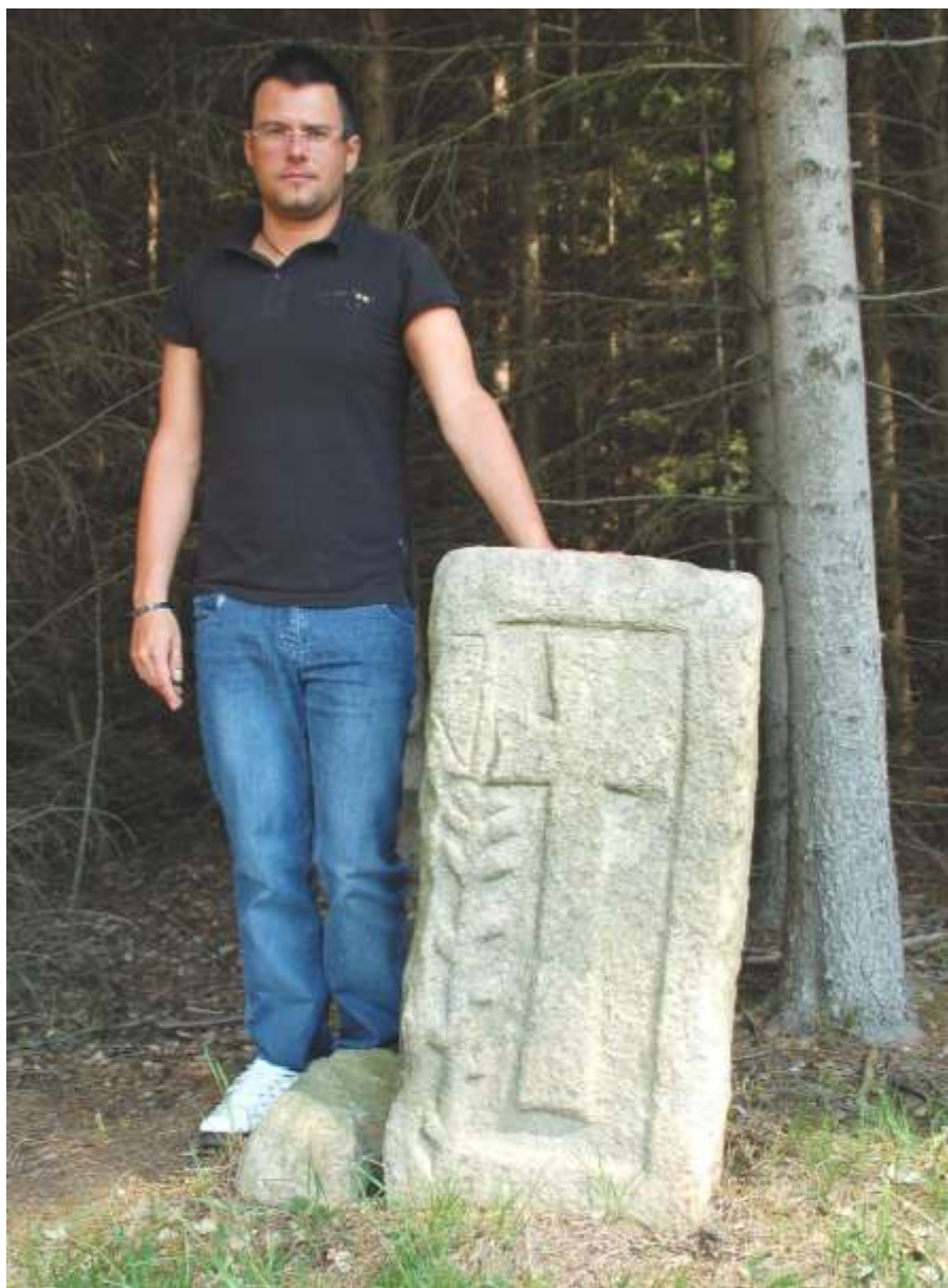
Smírčí kámen v katastru obce Hrbov (obr. k článku Starobylé kameny v okolí obce Hrbov )