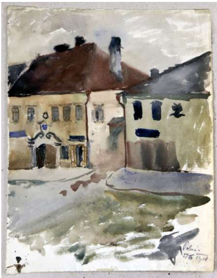
Josef Šíma: Polná, 5. 7. 1918; v originále barevný akvarel na papíře o rozměru 45x37 cm, ze sbírky MG v Brně (obr. k článku Světově proslulý malíř Josef Šíma maloval v Polně )