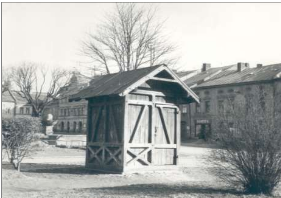
Městská váha před odstraněním, 1962 (archiv Městského muzea v Polné)