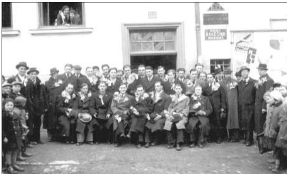
Mobilizace 1938 v Polně; muži před odjezdem ke svým vojenským útvarům