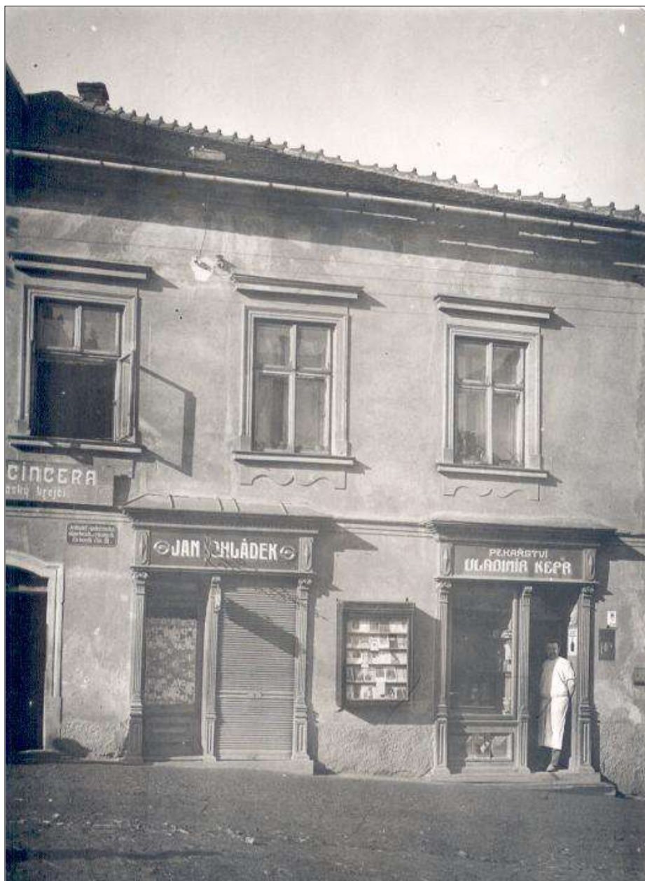
Dům čp. 67 na Sezimově náměstí pekaře Vladimíra Kepra, kde provozovali po roce 1920 svou živnost i holič Chládek a krejčí Činčera