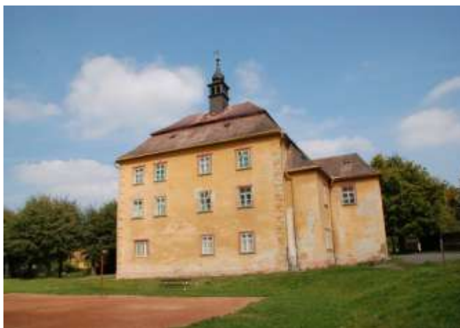
Zámek v Jamném; stav v roce 2004

velkostatku. Druhý inventář z doby úmrtí Dionysie Nussbaumové je nápadný tím, že vykazuje v zásadě pouze staré kusy nábytku 6 , což však nebylo v žádném případě způsobeno finančním nedostatkem, když se po budově povalovaly zapomenuté cenné papíry za desetitisíce korun 7 etc., ale spíše pokročilým věkem majitelů budovy. Přece jen však má i soupis nábytku, hodin a podobných kusů vybavení interiéru jakousi cenu – dokumentuje bohatství budovy, které v roce 1945 skončilo buďto v ohni nebo jako kořist ruských vojáků a jamenských usedlíků, u kterých se mnohdy nachází dodnes. Jednou z posledních zpráv o již rozkrádaném majetku je dopis faráře Bohumila Simonidese, toho času referenta Zemského národního výboru v Brně pověřeného zajistit knihy a starožitnosti z konfiskovaných nemovitostí, Fondu národní obnovy ze 14. prosince 1946 8 . P. Simonides se zde zmiňuje o značném množství odcizených předmětů, mj. knih, spisů, těžkých záclon, perských koberců a hodin i z 18. století. Smutný konec inventáře jamenského zámku však není předmětem tohoto příspěvku a bude mu snad věnován prostor v samostatné studii.