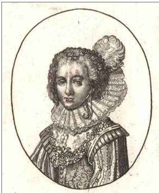
Alžběta Stuartovna, česká královna, na mědirytu Balthasara Moncorneta (1600–1668), rok 1620

běta Stuartovna s menšími dětmi v Nizozemsku. Syn Karel Ludvík bojoval ve švédském vojsku, Ruprecht odešel na dvůr svého strýce Karla I.