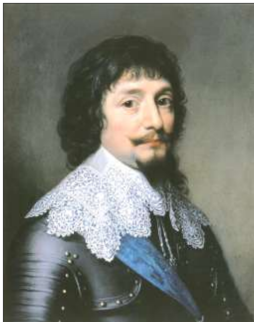
Fridrich Falcký na portrétu Michiela van Mierevelta (1567–1641), kol. 1630