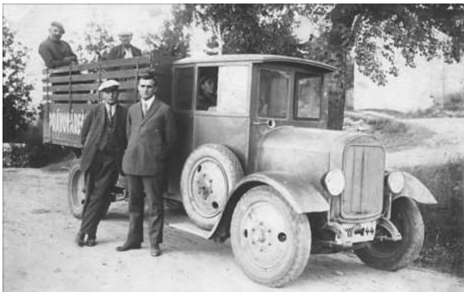
První nákladní automobil měšťanského Právovárečného pivovaru v Polné