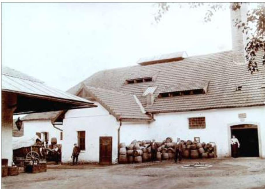
Varna měštanského pivovaru; foto cca po roce 1910