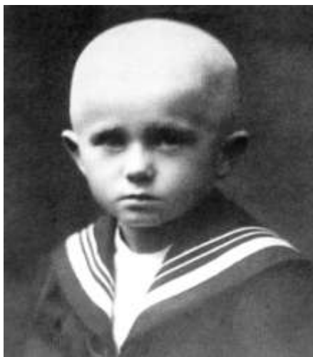
Malý Bohumil Hrabal v Polné, 1918