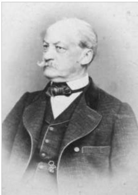
Ferdinand Voith von Sterbez (1813–1882)

V Německém (Havlíčkově) Brodě navštěvoval Ferdinand Voith hlavní školu a v letech 1824–1829 úspěšně absolvoval tamní premonstrátské gymnázium. Poté vystudoval práva na filosofické fakultě pražské univerzity, kde získal potřebnou průpravu pro vstup