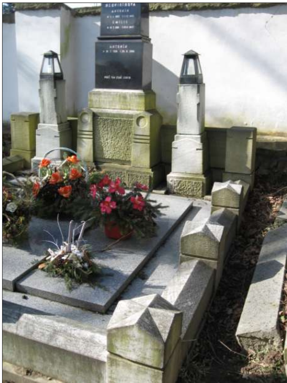
Hrobka č. 879 s kombinací secesních a kubistických prvků.