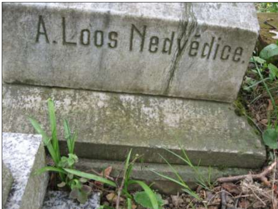
Signatura firmy na jednom z náhrobků.