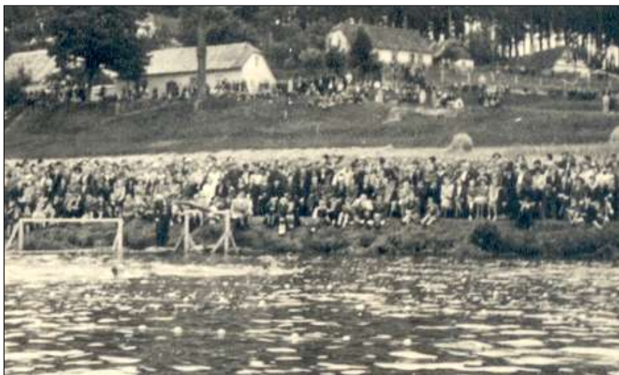
Plavecké závody na rybníku Peklo, 1940.