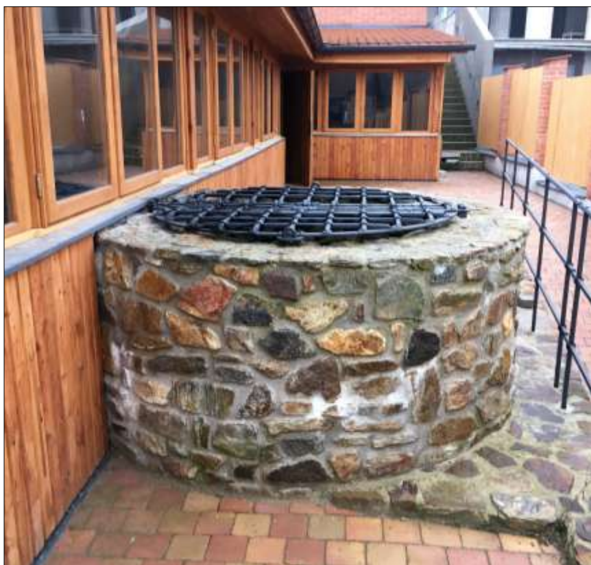
Nově opravená historická studna ve dvorním traktu za domem čp. 22 na Husově náměstí v Polné