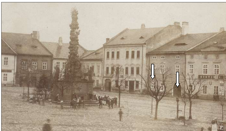
Dvě studně v prostoru mezi kašnou a oblakovým sloupem, 1890. Pravá studna opatřena pumpou, levá lucernou (studny označeny šipkami)

Ještě ve II. polovině 20. století byly mnohé studně v Polné lidmi využívány. Kupříkladu na Husově náměstí bývaly studně tři. Z dětství si vybavuji, že dvě se nacházely mezi kašnou (v současnosti nazývanou „Hastrmanka“) a oblakovým sloupem Nejsvětější Trojice. Často jsme si kolem „pump“, jak jsme je, my děti, nazývaly, hrály. Dle starých fotografií lze jednoznačně usuzovat, že pumpa (studně) blíže oblakového sloupu byla už před rokem 1890 využita, po navýšení kovovým nástavcem, jako lampa veřejného osvětlení. Třetí studně (pumpa) byla umístěna v dolní části Husova náměstí, poblíž pomníku padlým. Dobové snímky nám tudíž přesvědčivě dokládají, že na „rynku“ bývaly tři studně (později využívané tzv. pumpou). Proč byly mezi kašnou a oblakovým sloupem umístěny na malém prostoru dvě, lze mj. zdůvodnit jejich častým využíváním. Jedna z nich byla počátkem listopadu 2016 odkryta při budování chodníku mezi oblakovým sloupem a kašnou. Její stav a stáří, jakož i vhodnost případné renovace, by měli určit odborníci k tomu povolání.